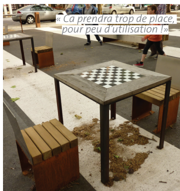
« Ca prendra trop de place, pour peu d'utilisation ! »