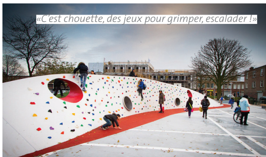
« C'est chouette, des jeux pour grimper, escalader ! »