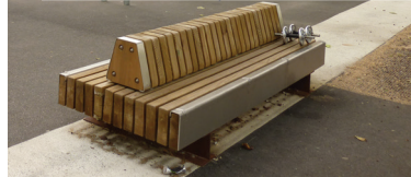
« Des bancs classiques, avec un dossier. »

Des bancs pourront compléter ces aménagements. L'installation de mobilier spécifique ou de jeux pour adultes n'a pas semblé adapté pour les participants, qui préfèrent privilégier des jeux pour les enfants et des bancs classiques.