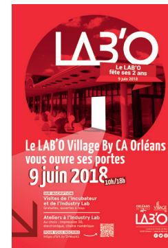
Pour tester son produit, production en petite série à l'Industry Lab.