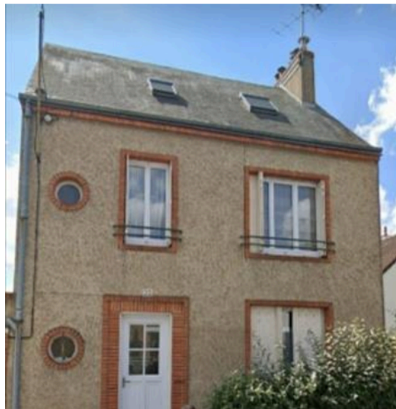
22 rue Danton

Nous demandons que la maison numéro 22 rue Danton à Fleury-les-Aubrais (voir photo en pièce jointe), caractéristique de la « Reconstruction d'après-guerre », soit repérée au titre de l'article L151-19 du code de l'urbanisme sur le plan de zonage. Nous demandons aussi, le même repérage pour toutes les maisons du quartier historique et pavillonnaire Lazare Carnot, Joie, Danton, Arago, construites à la même période.