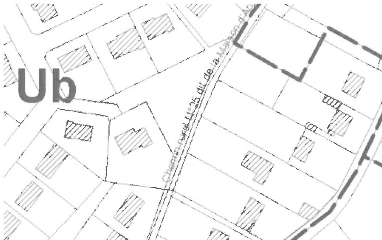
Plan de zonage actuel (PLU de Marigny les Usages)

Le futur PLU Métropolitain, nous situant en zone UR4-OL, ne nous permettra plus de réaliser notre projet.