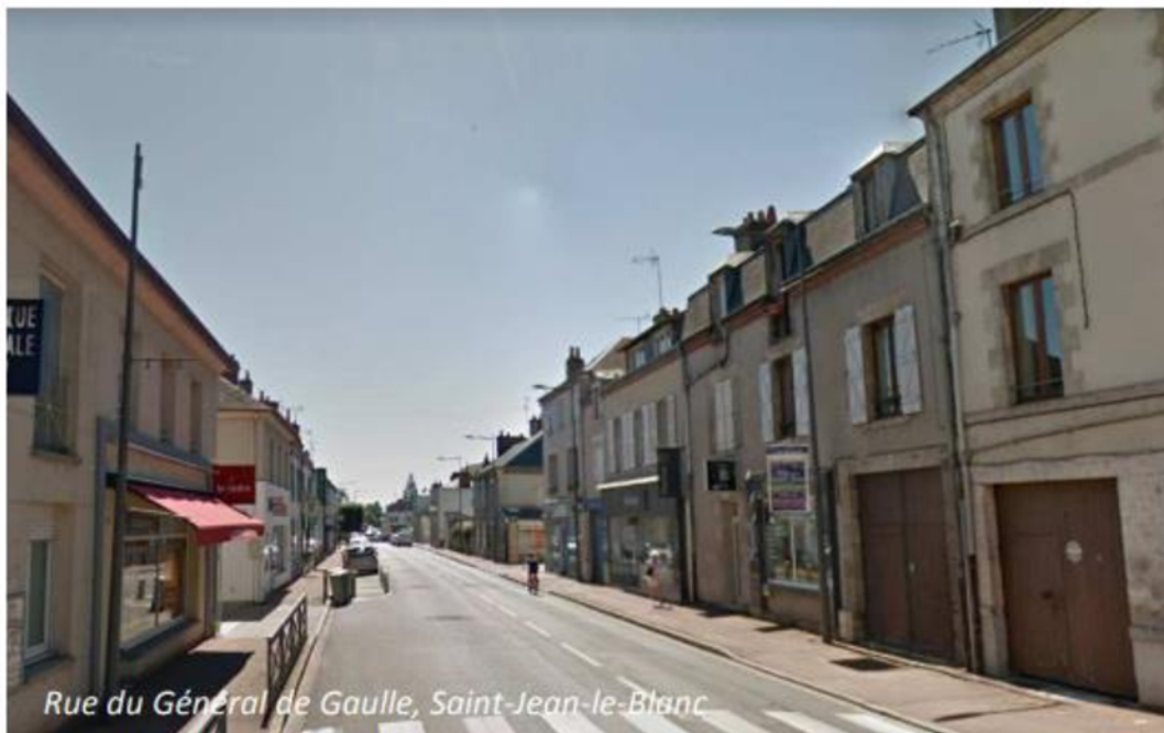
Illustration Extraite de l'OAP Patrimoine, caractérisant l'ensemble patrimonial du centre bourg de Saint Jean Le Blanc :