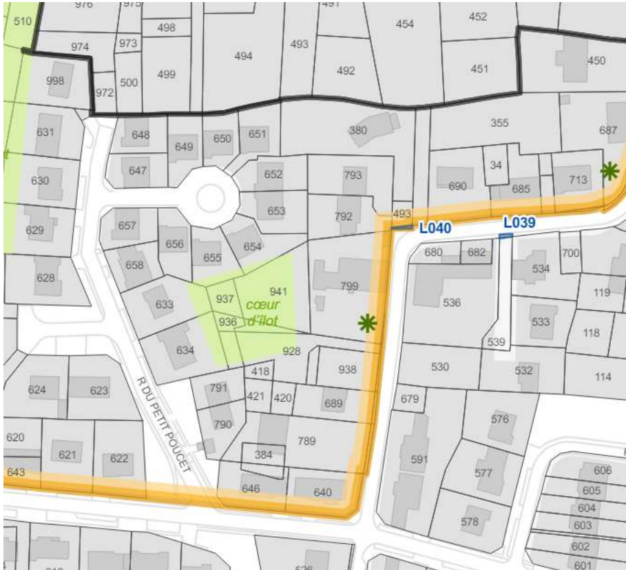
Proposition de modification (en rose)